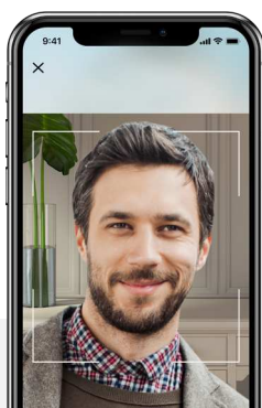
2. Automáticamente Verifique la Similitud