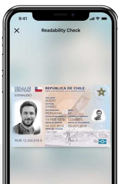
1. Comprobante de Identificación

En el back-end, Jumio aprovecha una plataforma AWS altamente segura y escalable con servicios estándar como Amazon S3, Amazon DynamoDB, Redis, Amazon RDS, Elasticsearch y Amazon Cognito.