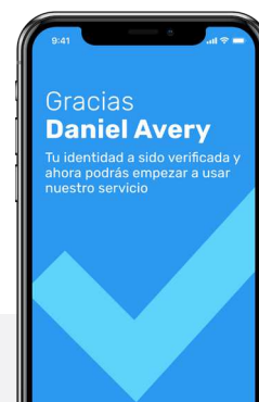
4. Respuesta Definitiva